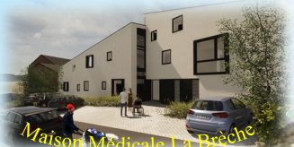
Maison Médicale La Brèche

Le Magazine des patients et soignants de la Maison Médicale La Brèche